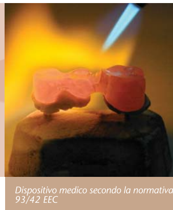
Dispositivo medico secondo la normativa 93/42 EEC

Solder LV 15 è un saldame universale, di colore giallo chiaro disponibile in bacchetta con Flux incorporato o senza, adatto alla saldatura di leghe preziose e non preziose