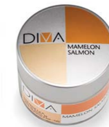
Opaque Dentin Mamelon